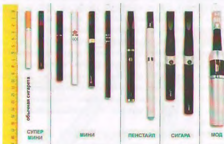
Рис.4. Типы и размеры электронных сигарет

Электронные сигареты (вейпы) классифицируются также по типу и размеру (рис.4) в соответствии с длиной (от 82 мм до 175 мм).