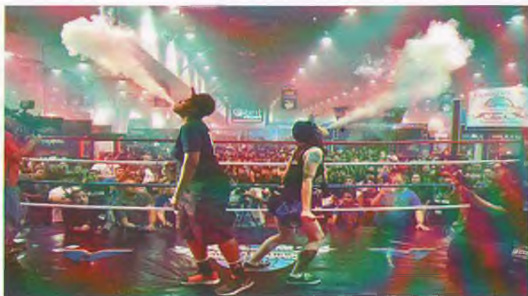
Рис. 2. Вейпинг соревнование

В Москве в 2019 году была проведена девятая по счету выставка VapeExpo.