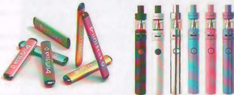
Рис. 5. Одноразовые (слева) и многоразовые (справа) электронные сигареты

Одноразовые ЭС рассчитаны на 200 - 500 затяжек пара. В многоразовых устройствах нет таких ограничений и они работают до тех пор, пока доливается жидкость в емкость.