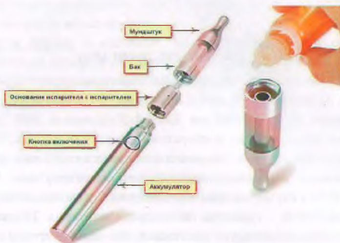
Рис. 3. Устройство электронной сигареты

Обычная электронная сигарета состоит из аккумулятора, электрического испарителя, емкости для жидкости, мундштука и дополнительных элементов для автоматического управления подачей ароматизированной жидкости (но последние имеются не во всех моделях), рис.3.