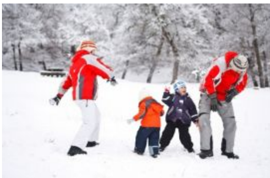
Прогулки на свежем воздухе