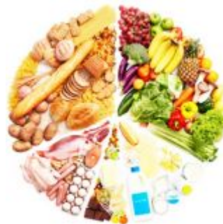
Правильное и здоровое питание