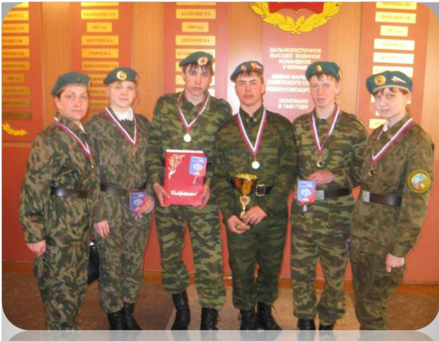
1 место в областной военно-спортивной игре «Зарница - 2009»