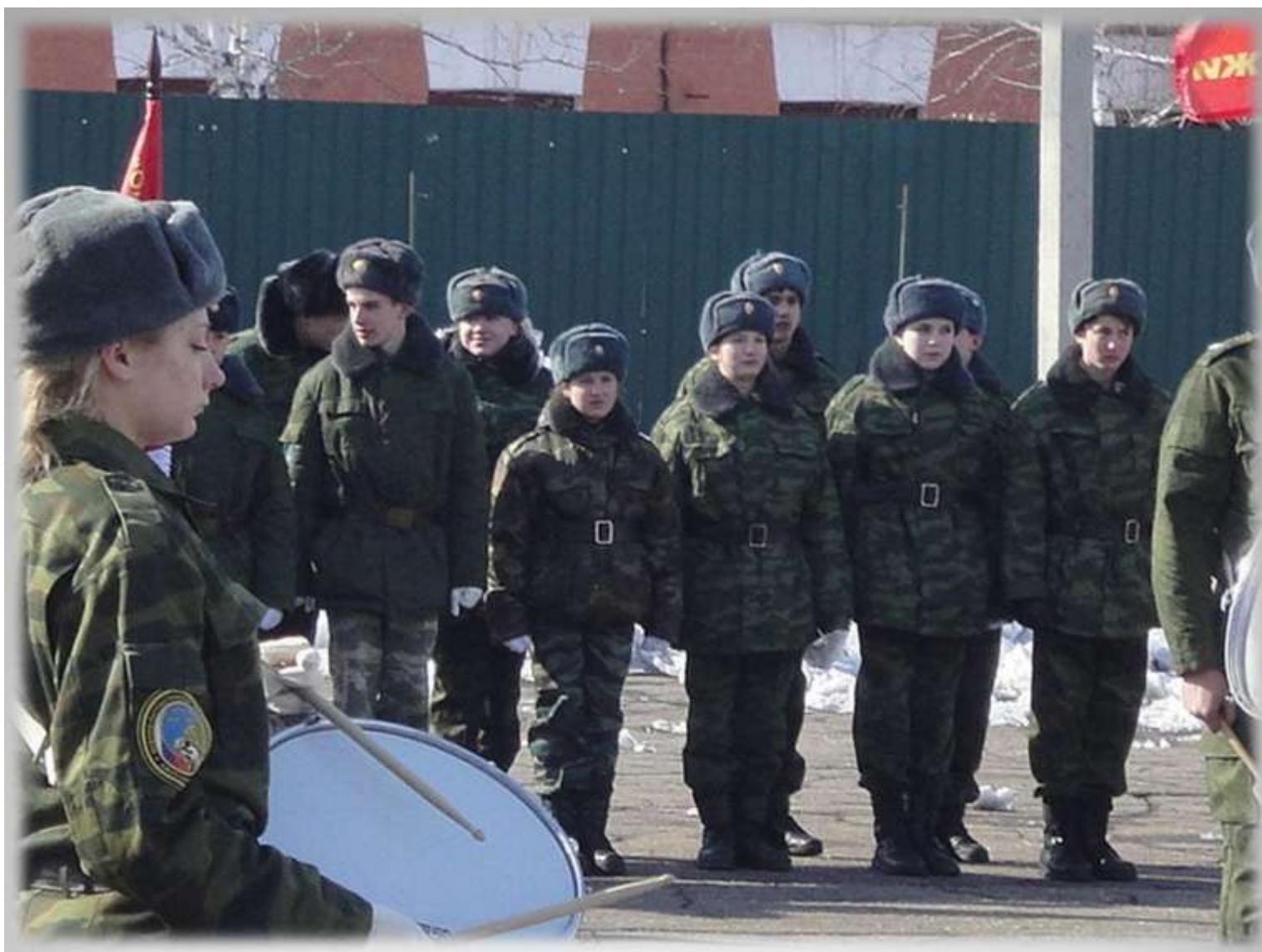
Областные военно-патриотические сборы «Рубеж-2014»